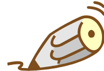
年収 250 万円未満程度