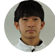
保健体育科主任 3年6組担任