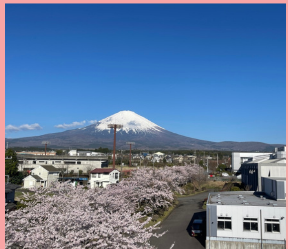
（本校から見た富士山と桜）

4月6日（月）より新年度がスタートしました。今年度は299名の新入生を迎え、学校内もこれまで以上に賑やかになっていくと思います。始まりということで、学校の目指す生徒像についてすべての生徒に伝えさせていただきました。「未来を切りひらく力」を身につけるために授業、探究、学校行事、課外活動、部活動、いろいろなことに積極的に挑戦していくこと。そしてそれを実践するために、昨年掲げているスクールモットー（行動指針）を大切にしていけることを伝えました。「想像以上の自分になる」ためには、自分の頭の中にあるイメージや固定概念を取り外し、力強く一歩を踏み出していかなければなりません。失敗もたくさんしていきましょう。時には、立ち止まっても構いません。時間をかけながら次の一歩を踏み出していきましょう。そんなみなさんを私たち教職員で、全力でサポートしていきたいです。